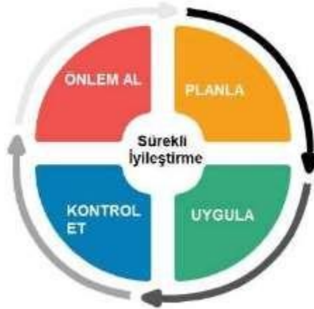
Şekil 1. PUKÖ Döngüsü

Yukarıda belirtilen adımlar özetle Planla-Uygula-Kontrol Et-Önem Al (PUKÖ) yaklaşımı olarak ifade edilebilir